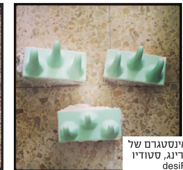
מהאינסטגרם של שני רינג, סטודיו desiRing

13.3 מיליארד שקל - זה הסכום שהוציאו הישראלים על שיפוצים בבית בשנת 2014, כך עולה ממסקר השנתי לבחינת שוק השיפוצים של מרכז הבנייה הישראלי (בשיתוף מכון גיאוקרטוגרפיה). הסכום הזה מקפל בתוכו 275 אלף משקי בית ששיפצו את מקום מגוריהם ומהווה עלייה של שבעה אחוזים לעומת 2013. אם צוללים אל תוך הנתונים מגלים כי עלות שיפוץ ממוצע לבית הסתכמה בכ-48,000 שקל, כולל עלויות החומרים והעבודה. "עם ישראל אוהב להשקיע בבית, ואנחנו רואים זאת שנה אחרי שנה", מסכם ישראל מסטרנק, מנכ"ל מרכז הבנייה הישראלי.